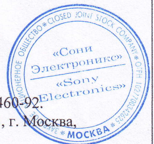
Схема сертификации: 3.

Карамышевский проезд, д. 6; тел. 7(495) 258-7667, факс 7 (495) 258-7650.