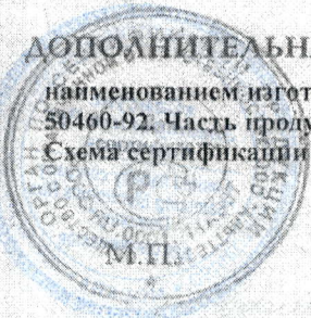
Схема сертификации 3.

Знак соответствия наносится на упаковке рядом с наименованием изготовителя и в товаро-сопроводительной документации. Форма и размер знака по ГОСТ Р 50460-92. Часть продукции промаркирована знаками РСТ АЯ46, АЕ95.