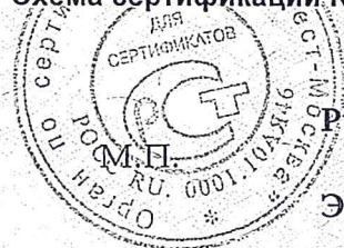
Схема сертификации № 3.

Маркирование знаком соответствия по ГОСТ Р 50460-92.