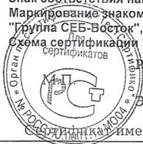
Схема сертификации 3.

Знак соответствия наносится на изделие, упаковку и в сопроводительную документацию. Маркирование знаком соответствия по ГОСТ Р 50460-92. Официальный представитель в РФ ЗАО "Группа СЕБ-Восток", 119180, Москва, Старомонетный пер., д. 14, стр. 2.