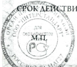
Схема сертификации: Зс.

СРОК ДЕЙСТВИЯ С 01.11.2013 ПО - ВКЛЮЧИТЕЛЬНО