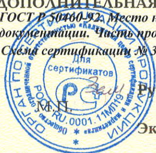
Схема сертификации № 3

ДОПОЛНИТЕЛЬНАЯ ИНФОРМАЦИЯ Маркировка продукции знаком соответствия производится по ГОСТ Р 50460-92. Место нанесения знака соответствия - на изделии и (или) на упаковке и в сопроводительной документации. Часть продукции промаркирована знаком соответствия АИ46.