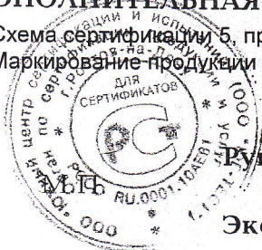
Схема сертификации 5, предусматривающая проведение ежегодного инспекционного контроля. Маркирование продукции знаком соответствия по ГОСТ Р 50460-92 производится на маркировке изделия.