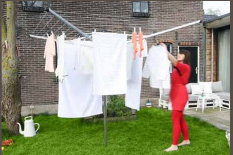
Designed for daily use

Over the course of the next 20 years please help us recycle this product by taking it to a recycling centre once it has reached the end of its life in your home. This way you help us in achieving our long-term goal toward 100% recycling.