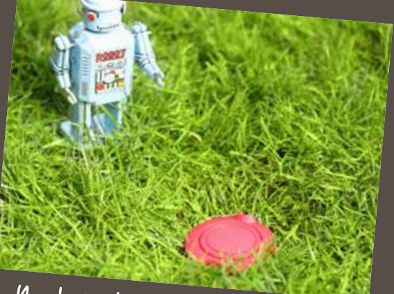
No obstacles for playing children or when mowing the lawn