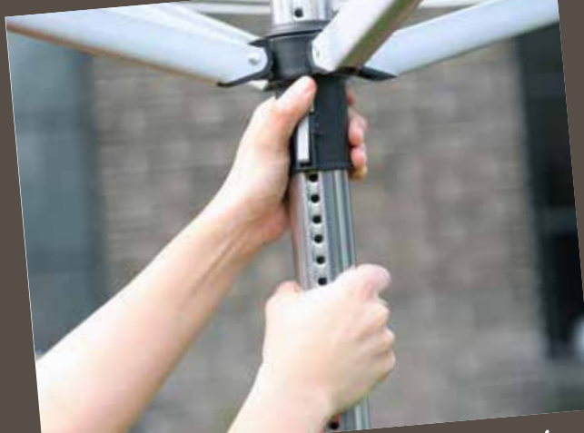
Seamless comfort – adjustable working height