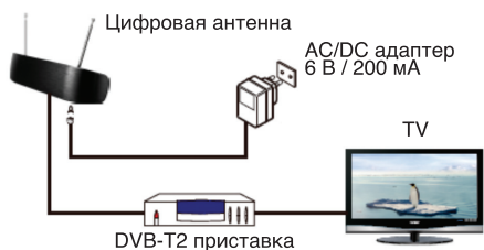
Рис. 1. Питание через адаптер переменного/постоянного тока