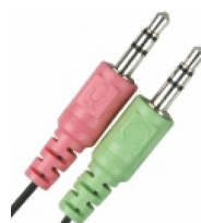
Сtereo-разъем 3,5 мм x 2 шт