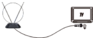
(рис. 2) Подключение через DVB-T2 приемник