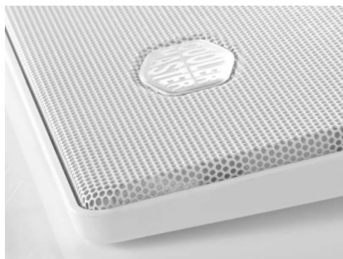
Металлическая поверхность с перфорацией

Note: Photos may differ slightly from the final product