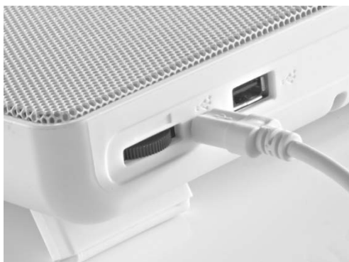
Колесико регулировки скорости вращения вентилятора