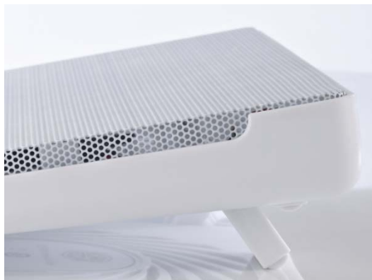
Тонкая и легкая