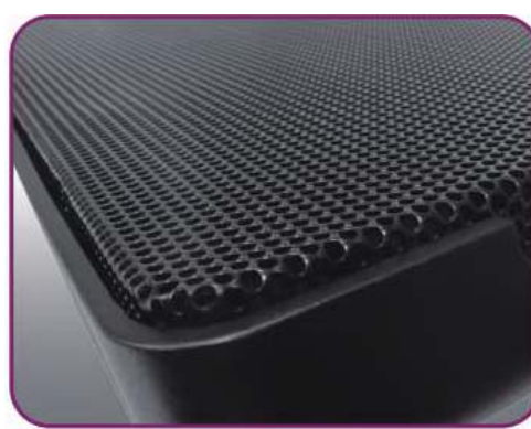
Металлическая поверхность с перфорацией