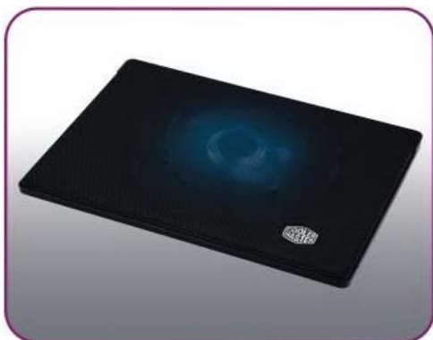
Тонкая и легкая