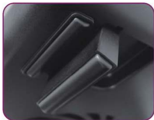
Изменяемый угол наклона