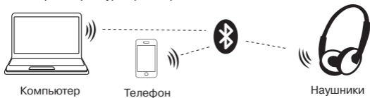
Рис. 2. Схема подключения