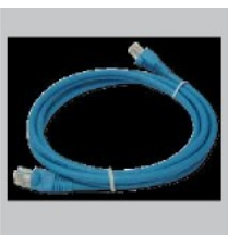
Кабель Ethernet (UTP, 5 категории)