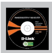
КОМПАКТ-ДИСК (D-Link Click'n'Connect, руководство пользователя и гарантия)