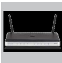
DIR-615 БЕСПРОВОДНОЙ МАРШРУТИЗАТОР 802.11N (проект) ДЛЯ ДОМА

Если что-либо из содержимого отсутствует, пожалуйста, обратитесь к Вашему поставщику.