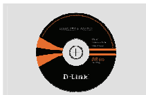
Компакт-диск (Мастер по быстрой установке маршрутизатора и руководство пользователя)