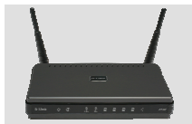
DIR-628 RANGEBOOSTER N® DUAL BAND ROUTER

Если что-либо из содержимого отсутствует, пожалуйста, обратитесь к поставщику.