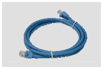
Кабель Ethernet (CAT5 UTP)