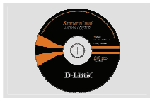
Компакт-диск (Мастер по быстрой установке маршрутизатора и руководство пользователя)