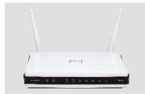
DIR-825 XTREME N™ DUAL BAND GIGABIT ROUTER

Если что-либо из содержимого отсутствует, пожалуйста, обратитесь к поставщику.