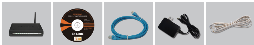
DSL-2640U WIRELESS G ADSL2+ ROUTER

Если какая-то позиция отсутствует или повреждена, пожалуйста, свяжитесь с реселлером D-Link.