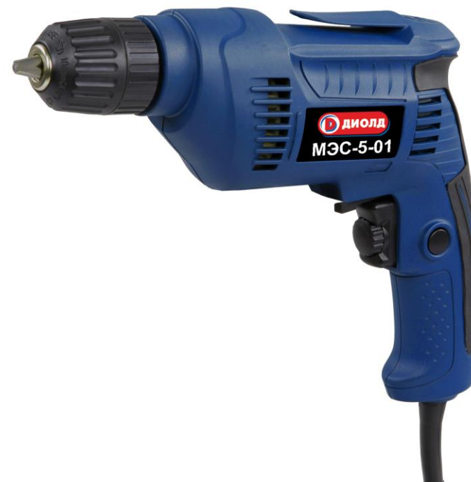
Машина ручная электрическая сверлильная МЭС-5-01 (Арт. 10011020/10011021)

РОССИЯ 214031 г. СМОЛЕНСК ул. ИНДУСТРИАЛЬНАЯ - 2 ЗАО "ДИФФУЗИОН ИНСТРУМЕНТ" Вопросы по гарантии: тел/факс (4812) 31-73-85 тел. 31-80-29 Отдел сбыта: тел/факс (4812) 61-15-48, 55-30-92