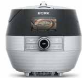
МУЛЬТИШЕФ U 803