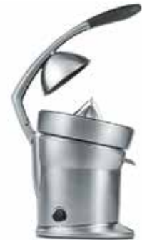
СОКОВЫЖИМАТЕЛЬ Z 800