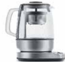
ЧАЙНИК K 810