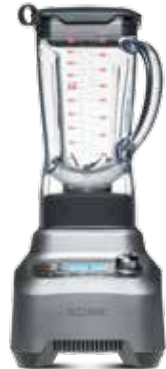
БЛЕНДЕР B 802