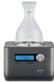
ДЕКАНТЕР Z 600