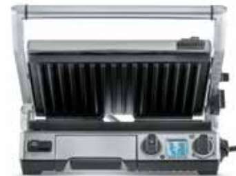
ГРИЛЬ G 802