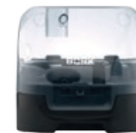
Контейнер для хранения насадок