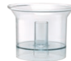
Малая чаша объемом 600 мл