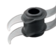
Система ножей с четырьмя лезвиями QUAD BLADE