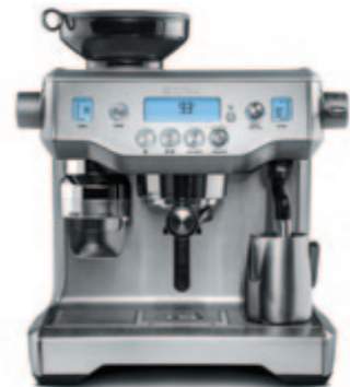
КОФЕЙНАЯ СТАНЦИЯ C805