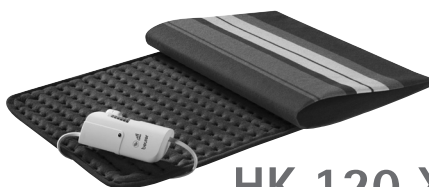
HK 120 XXL

RUS Электрическая грелка Инструкция по применению