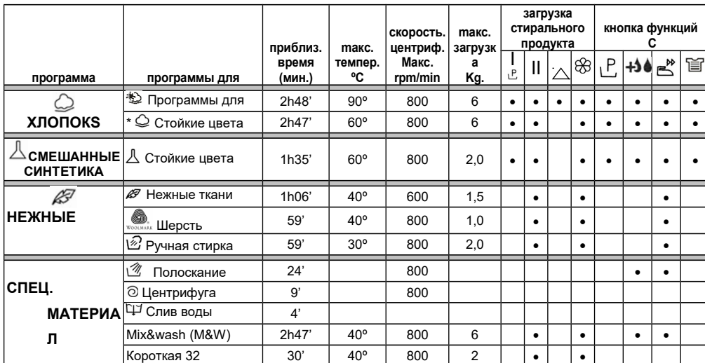
Таблица программ мод. CTD 866

* Рекомендуемая программа для стирки теплой водой (температура ниже указанного максимума). Тестовая программа стирки на соответствие требованиям стандарта CENELEC EN 60456 с максимальной степенью загрязненности.