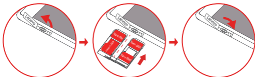
Рисунок 2: WLAN + LTE