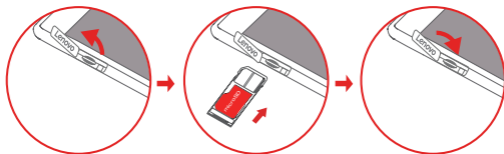
Рисунок 1: WLAN