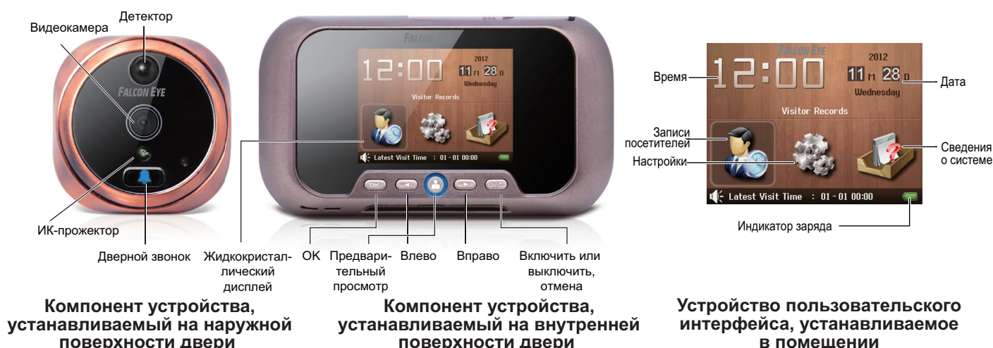
Компонент устройства, устанавливаемый на наружной поверхности двери