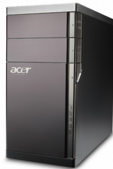
Модели: Aspire M5400, M5910