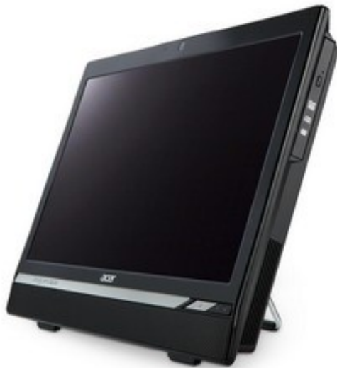
Модели: Aspire Z3170, Z3171, Z3770, Z3771, Z5770, Z5771