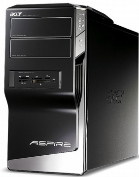
Модели: Aspire M5300, M5800, M5810