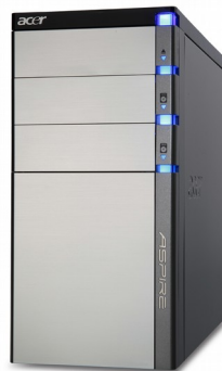
Модели: Aspire G5900, G5910, G5920