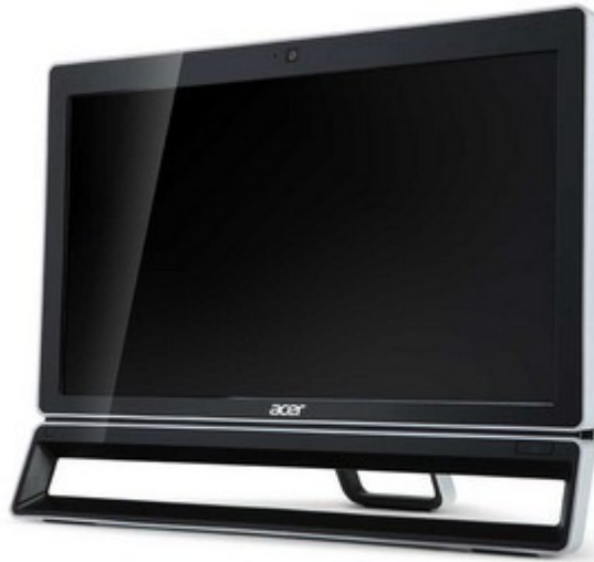
Модели Aspire Z3801, Z5801