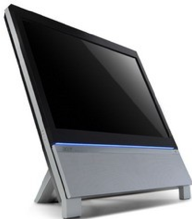
Модели: Aspire Z3620, Z3680