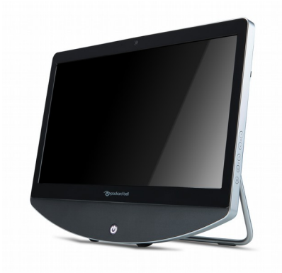
Модели Packard Bell oneTwo L5870/L5871