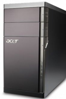
Модели: Aspire M5400, M5910