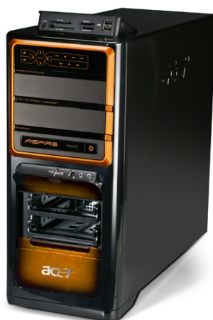
Модели: Aspire M7200, M7300