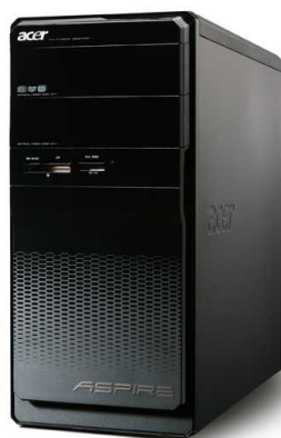
Модели: Aspire M3400, M3910