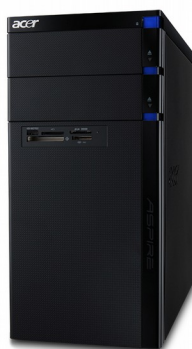
Модели: Aspire M5100, M5200, M5600, M5610, M5630, M5640