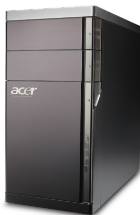
Модели: Aspire M5400, M5910