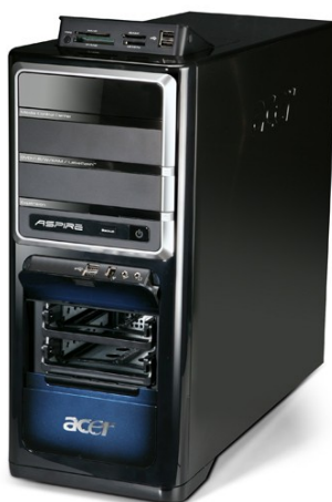
Модели: Aspire G7700, G7710, G7711, G7720