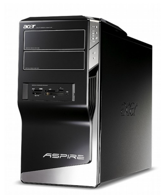
Модели: Aspire M5300, M5800, M5810