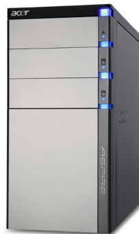
Модели: Aspire G5900, G5910