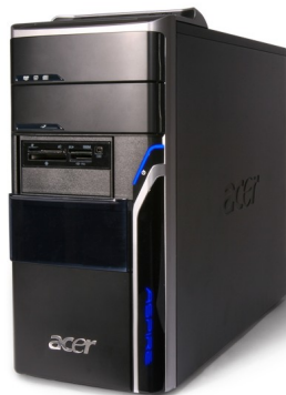
Модели: Aspire M5201, M5641