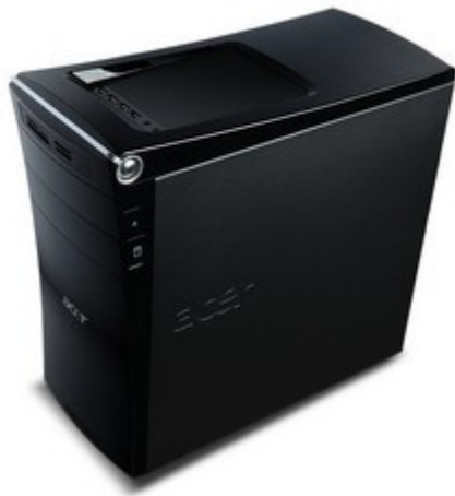
Модели: Aspire G3100, G3600, G3610