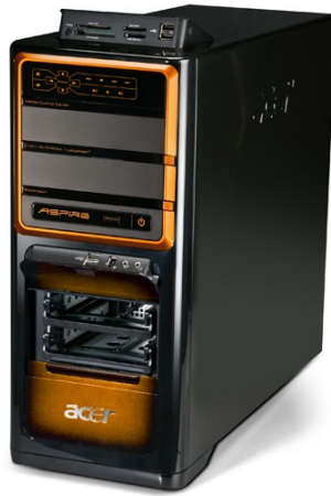
Модели: Aspire M7200, M7300