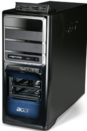
Модели: Aspire G7700, G7710, G7711, G7720