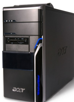
Модели: Aspire M5201, M5641