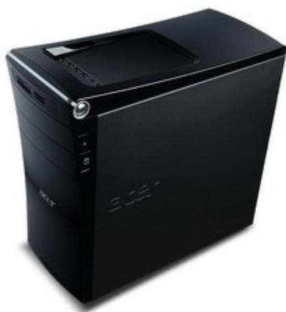
Модели: Aspire G3100, G3600, G3610