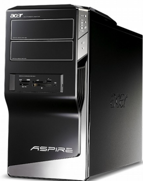
Модели: Aspire M5300, M5800, M5810