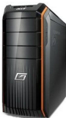
Модели: Aspire M5100, M5200, M5600, M5610, M5630, M5640