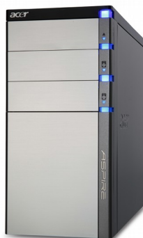
Модели: Aspire G5900, G5910