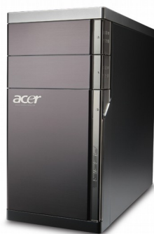
Модели: Aspire M5400, M5910