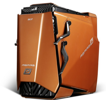
Модели: Aspire G7200, G7300