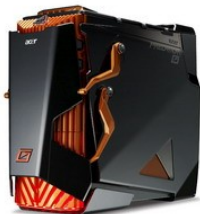
Компактное исполнение корпуса