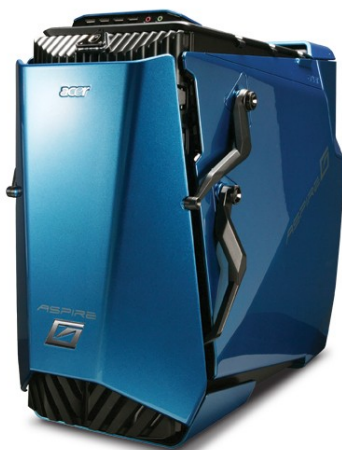
Модели: Aspire G7750