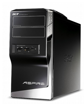
Модели: Aspire M5300, M5800, M5810