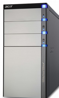
Модели: Aspire M7700, M7710, M7711, M7720, M7721