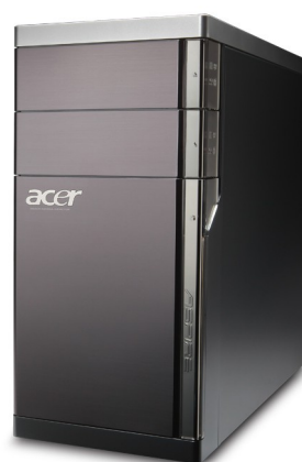
Модели: Aspire M5400, M5910