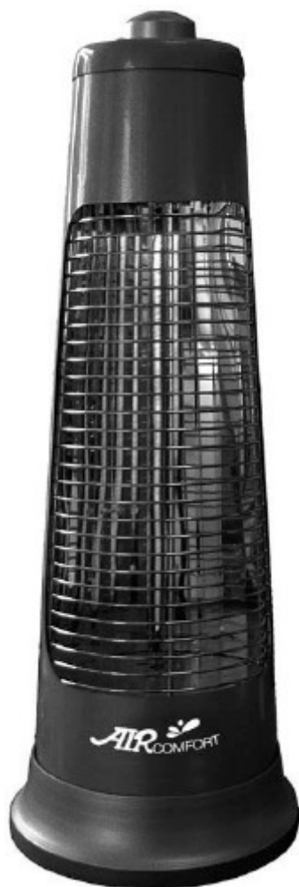
Обогреватель AirComfort AD-H600R