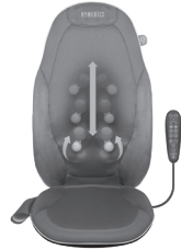
2'si 1 arada hareket eden Gel Shiatsu masaj mekanizması

Güvenliğiniz için ilgili masaj programı açık değilken ısı kullanımı açılmaz.