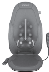
Подвижный механизм 2 в 1 для массажа шиатцу с гелем Gel

ПРОГРАММЫ РОЛИКОВОГО МАССАЖА – Выберите одну из 3 стандартных программ роликового массажа. Массажный блок будет перемещаться вверх-вниз в пределах определенной области спины. Для выбора программы нажмите кнопку. Загорится соответствующий светодиод. Для отмены выбора нажмите ту же или другую кнопку.