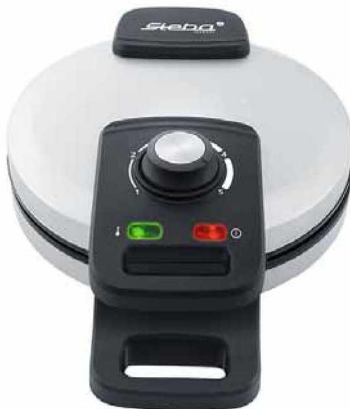
Вафельница WE 15