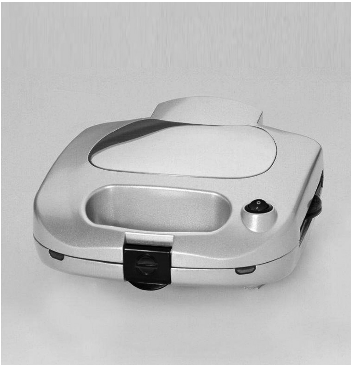
Сэндвичница SG 35