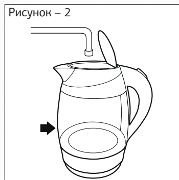
Рисунок – 2

— Наполните чайник холодной водой, следите за метками.