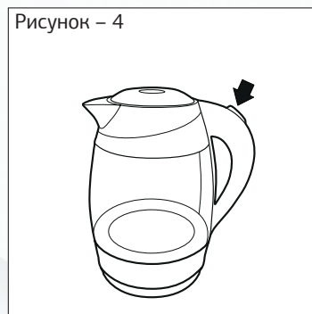
Рисунок – 4

— Включите чайник, нажав кнопку (переведя выключатель в положение 1).