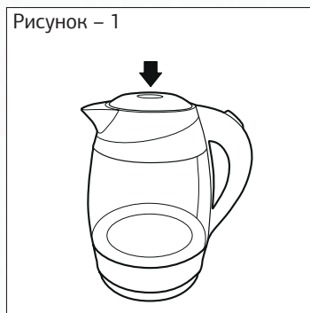
Рисунок – 1