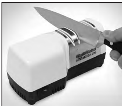
Рисунок 3. Вставьте лезвие ножа в правый паз устройства 1. Сделайте по несколько проходов в каждом из пазов (левом и правом).

Для повторной заточки повторите процедуру, описанную для точильного устройства 2. Сделайте 2-3 полных возвратно-поступательных прохода, сохраняя легкое усилие нажатия. При правильном вращении дисков вы услышите характерный звук. После этого проверьте кромку лезвия на остроту. При необходимости, произведите дополнительную заточку, но сначала проведите лезвие в устройстве 1, после чего уже сделайте 2-3 возвратно-поступательных движения в устройстве номер 2. Обычно освежить остроту лезвия можно в устройстве 2, и только после нескольких раз вам придется вновь воспользоваться устройством 1.