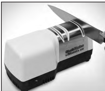
Рисунок 4. Нож в устройстве 2. Совершайте ножом возвратно-поступательные движения, не надавливая на него с чрезмерным усилием, как сказано в инструкции.