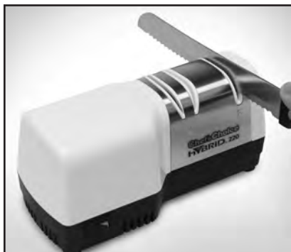
Рисунок 5. Нож-пилка в устройстве 2.

Не используйте точилку Hybrid ® для ножей с односторонней заточкой под одним углом, таких как ножи Kataba, традиционно используемые для приготовления сашими. Устройство 2 одновременно затачивает обе стороны режущего края, в то время как ножи для сашими предназначены для заточки лишь с одной стороны. Для такого типа ножей подойдет электрическая точилка Chef'sChoice, упомянутая в предыдущем абзаце.