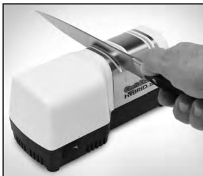
Рисунок 1. Вставьте лезвие ножа в левый паз устройства 1. Проведите лезвием по разу в левом и правом пазу в направлении «на себя».

На рисунке 2 изображено, как проверить наличие заусенца. Делайте следующий образ: если последний раз вы затачивали лезвие в правом пазу, то заусенец должен находиться на правой стороне кромки лезвия. Если последний раз вы затачивали лезвие в левом пазу, то заусенец должен находиться на левой стороне кромки лезвия. Если заусенец не образовался, нужно сделать еще по одному проходу по правому и левому пазам. Повторяйте