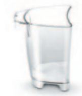
Контейнер для мякоти