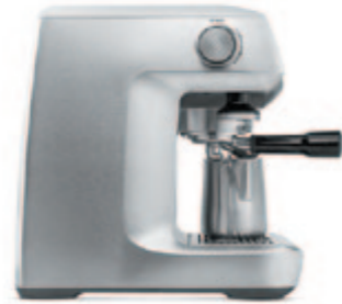
КОФЕЙНАЯ СТАНЦИЯ C802