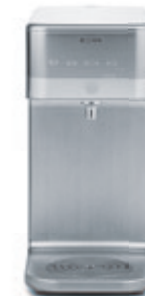
СИСТЕМА ОЧИСТКИ ВОДЫ K890