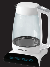
чайник PWK 1507CGD

Линия инновационной техники WHITE NIGHT от