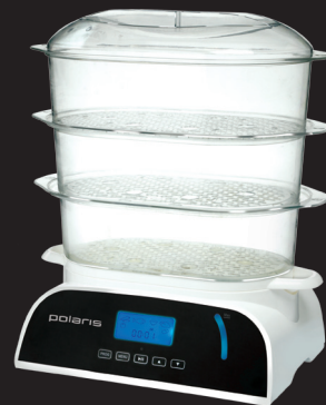
пароварка PFS 0308D