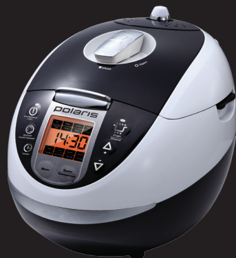
мультиварка-скороварка PPM 0124D