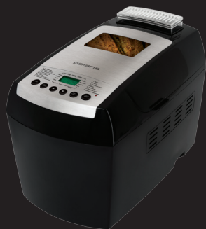
хлебопечка PBM 1501D