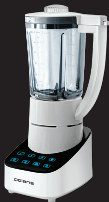
блендер PTB 0203G