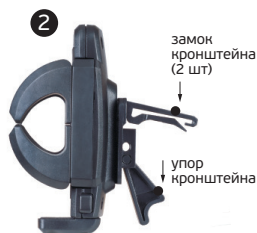
2. КРЕПЛЕНИЕ НА ВЕНТИЛЯЦИОННУЮ РЕШЕТКУ