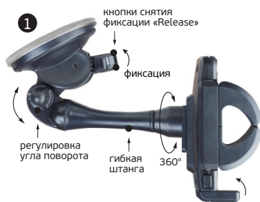
1. КРЕПЛЕНИЕ НА ЛОБОВОМ СТЕКЛЕ