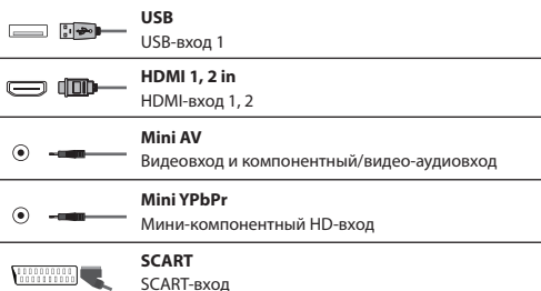
Схема подключения представлена на странице 20.