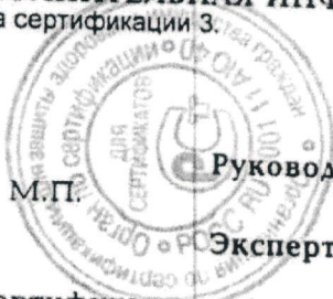
Схема сертификации З.