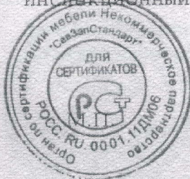
Схема сертификации № 3

Инспекционный контроль: февраль 2012 г., февраль 2013 г.