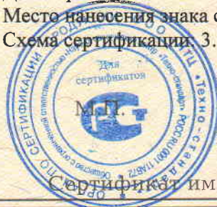
Схема сертификации: 3.

Место нанесения знака соответствия: на изделия и в сопроводительной технической документации.