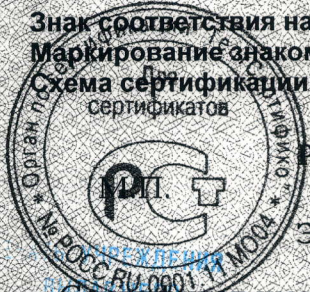
Схема сертификации 3.

Маркирование знаком соответствия по ГОСТ Р 50460-92.