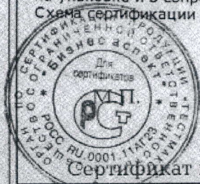
Схема сертификации З.

Маркировка продукции знаком соответствия производится по ГОСТ Р 50460-92. Место нанесения знака соответствия на упаковке и в сопроводительной документации.