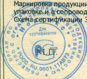
Схема сертификации З.

Маркировка продукции знаком соответствия производится по ГОСТ Р 50460-92. Место нанесения знака соответствия на упаковке и в сопроводительной документации.